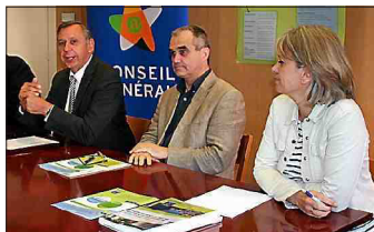
La diminution du volume des déchets ménagers est prônée par le Département.

Le plan de prévention et de gestion des déchets non dangereux s'appuie sur la notion de « prévention ». L'objectif clairement affiché par le conseil général est de réduire de 10 % le tonnage de déchets ménagers durant les douze années de vie dudit plan. D'autres « axes forts », définis dans le projet présenté au public, sont également mis en avant. Ils portent, par exemple, sur ce que Jean-François Albespys appelle « les déchets occasionnels des ménages », c'est-à-dire ceux qui sont déposés dans les déchetteries. Sur ce point, le vice-président rappelle qu'il existe en Aveyron 40 structures de ce genre, lesquelles couvrent l'ensemble du territoire, et évoque « la création de quelques déchetteries complémentaires ». Il prévoit, dans la foulée, « une harmonisation des conditions d'accueil ».